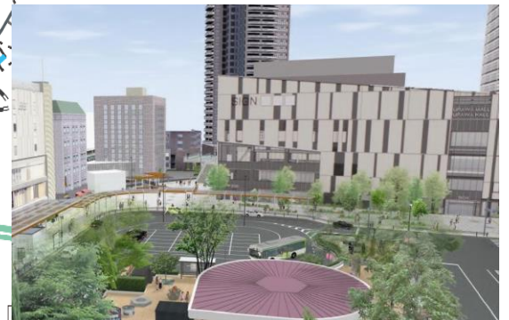
浦和駅西口南高砂地区 令和8年度 竣工(予定)