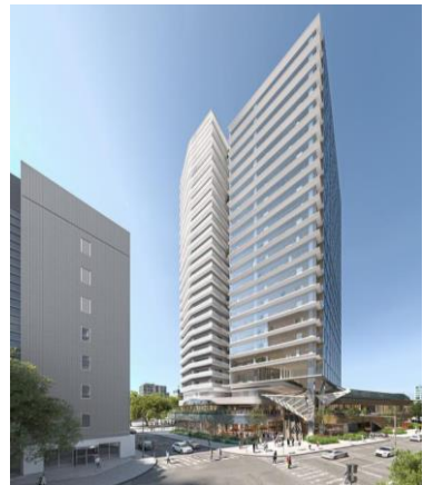
大宮駅西口第3-A・D 地区 令和9年度 竣工(予定)