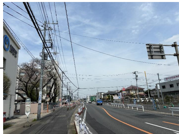
南北軸 産業道路（事業中）