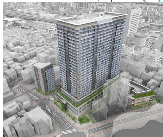
大宮駅西口第3-B 地区 令和6年7月 竣工