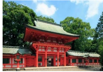
武蔵一宮 氷川神社