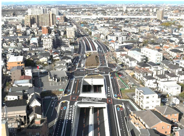
東西軸 道場三室線（事業中）