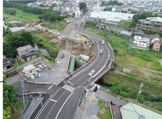
東西軸 大宮岩槻線（事業中）