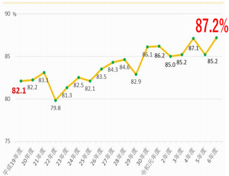
「さいたま市民意識調査」より