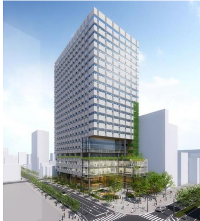
大宮駅東口大門町3丁目中地区 令和10年度 竣工(予定)