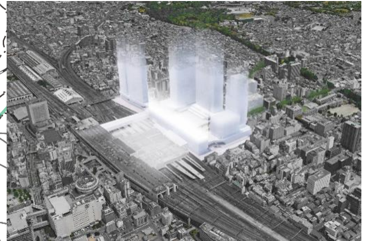
大宮駅グランドセントラル ステーション化構想 (検討中)