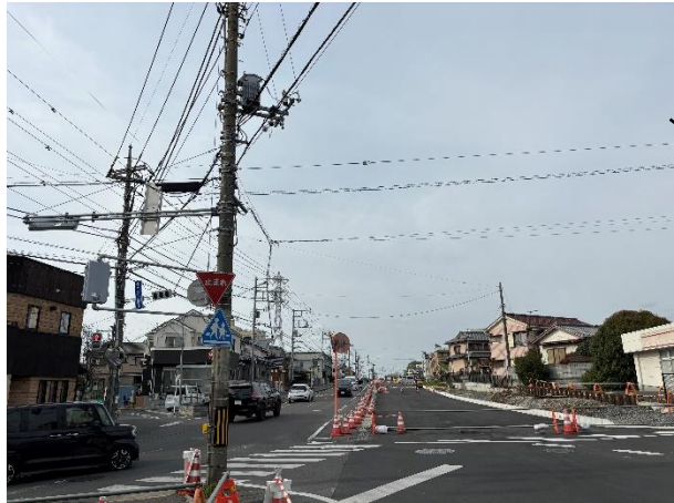
南北軸 産業道路（事業中）

○高規格道路へのアクセスや各地域拠点間の連携を強化し、骨格となるネットワークを構築