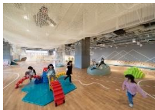
▲ 4階 子育て支援施設「ツナグテ」