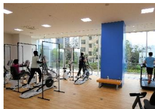
▲ 3階 健康・運動施設「ウゴクテ」